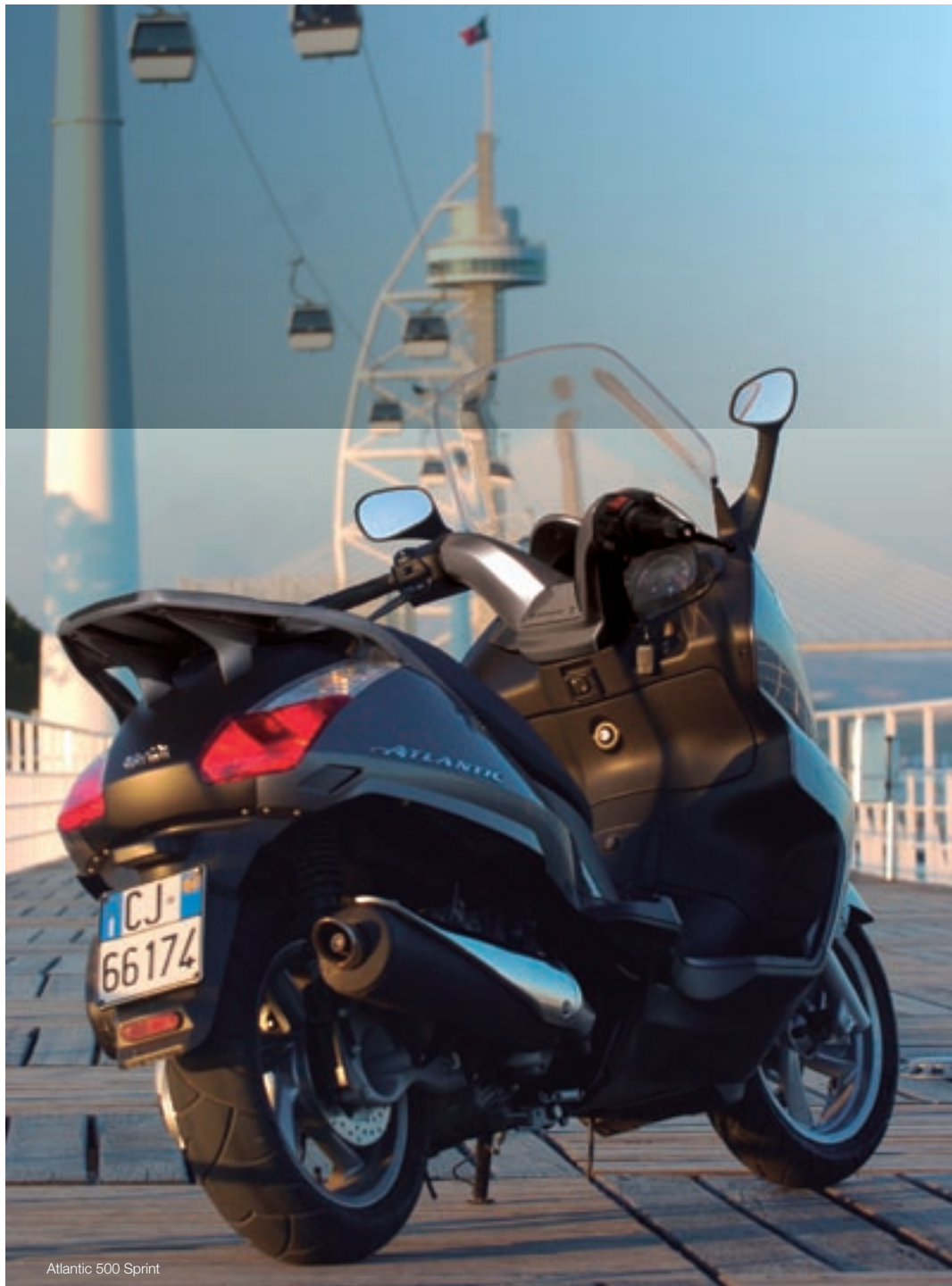
Atlantic 500 Sprint